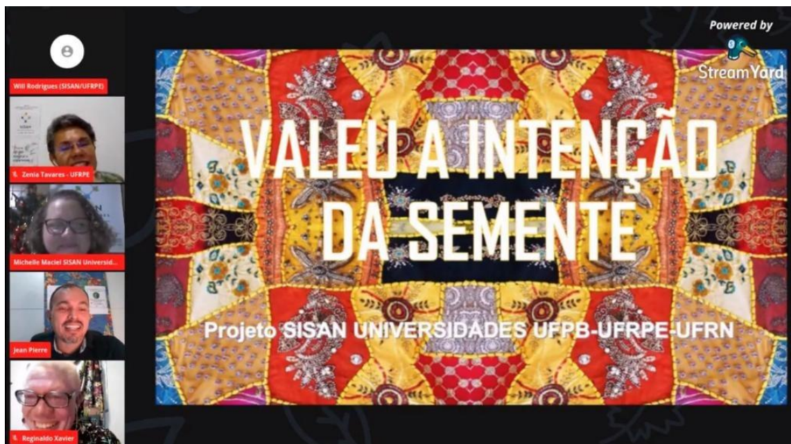
Encerramento do Projeto SISAN Universidades – UFRPE – UFPB – UFRN em dezembro 2020

4. Projeto SISAN Universidades – UFRPE-UFPB-UFRN: Ações de pesquisa e extensão partindo da perspectiva da educação popular, relacionadas ao campo Segurança Alimentar Nutricional nos estados de PE, PB e RN. O Projeto SISAN Universidades – UFRPE-UFPB-UFRN mobilizado pelo Núcleo de Consumo e Economia Familiar – NECEF do Departamento de Ciências do Consumo da UFRPE articulou-se com diversos atores sociais, municípios e organizações da sociedade civil no sentido de construir estratégias e possibilidades para o fortalecimento do Sistema Nacional de Segurança Alimentar e Nutricional. Um dos resultados dessa caminhada foi a integração e participação do Instituto Menino Miguel ao Fórum Estadual de Segurança Alimentar e Nutricional – FESSAN/PE.